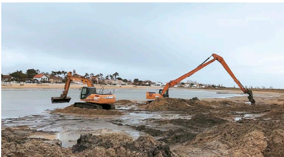
En 2018, 15 000 m 3 d'argile ont consolidé l'ouvrage

Comme expliqué lors d'une réunion avec les riverains le 12 mars 2018, pour réaliser les travaux de réfection et d'extension (au nord et au sud) du cordon dunaire, le dossier de Marennes-Plage doit être approuvé par une commission nationale puis obtenir la labellisation du Programme d'Action de Prévention des Inondations (PAPI), ce qui est déterminant pour l'autorisation à réaliser les travaux et l'attribution d'aides de l'État et de la Région. Ce dossier est toujours dans sa phase d'élaboration par le syndicat mixte d'accompagnement du Sage Seudre (SMASS) dont est membre la communauté de communes du Bassin de Marennes, chargée de réaliser les travaux.