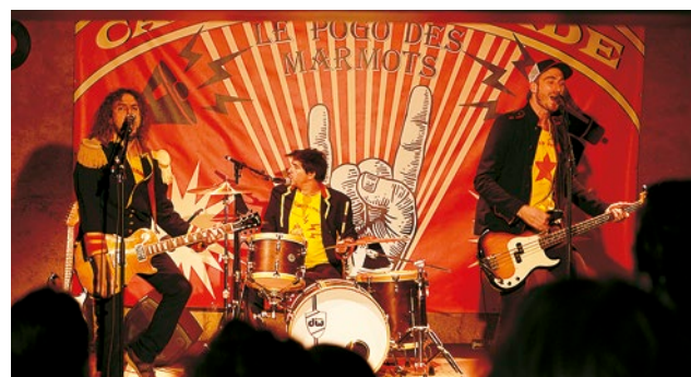
Les enfants petits et grands étaient au rendez-vous du concert de Captain Parade. Bonne humeur et musiques survitaminées ont électrisé ce dimanche après-midi.