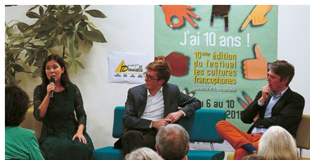
Le festival s'est ouvert avec l'intervention de Catherine Fournier, benjamine de l'Assemblée Nationale du Québec. Bien que jeune, elle a pu partager son expérience politique déjà solide et expliqué les raisons de son engagement.