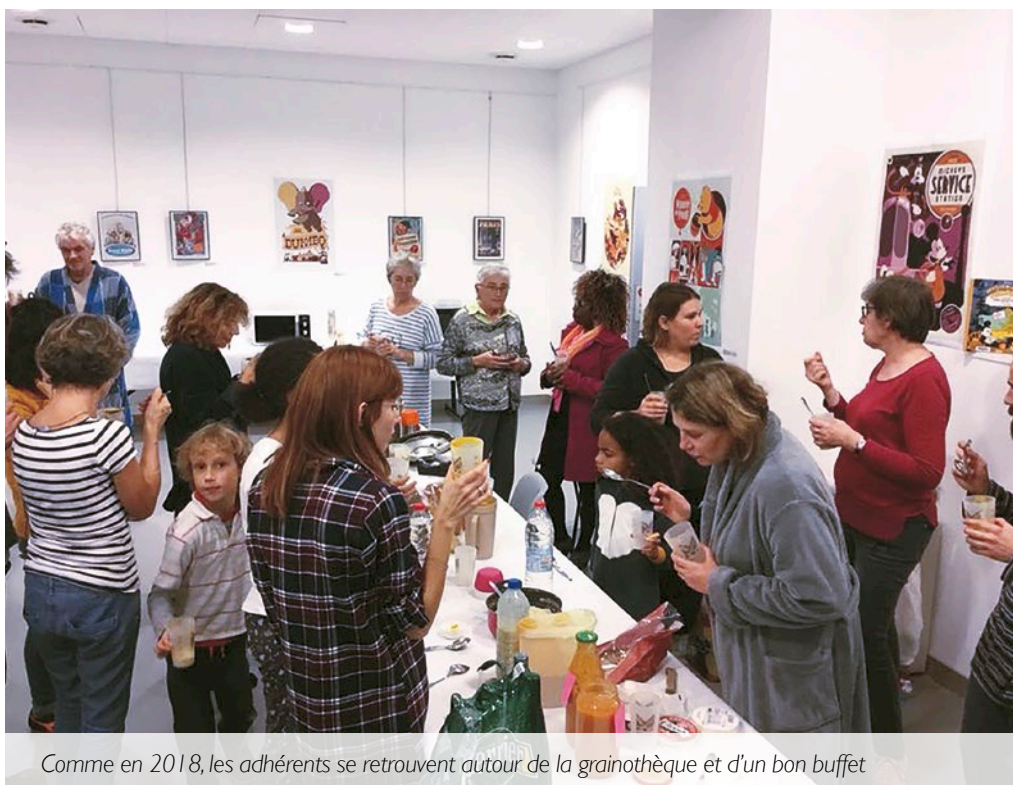
Comme en 2018, les adhérents se retrouvent autour de la grainothèque et d'un bon buffet

La médiathèque met à disposition des livres, des DVD, des CD, des revues, mais aussi des graines ! La grainothèque qui permet l'échange de graines pour favoriser la diversité est aussi le prétexte à l'organisation d'activités autour de ce thème.