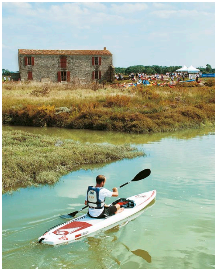
Les activités de loisirs et en famille ont été privilégiées