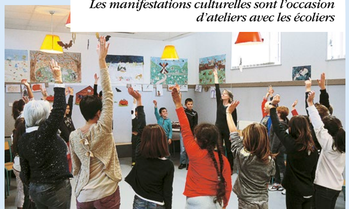
Les manifestations culturelles sont l'occasion d'ateliers avec les écoliers