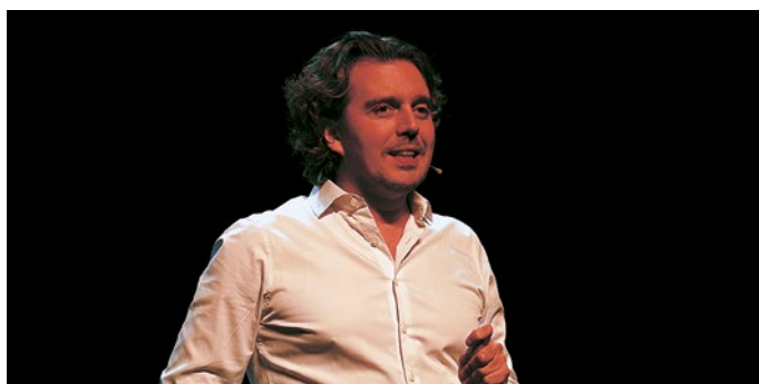
C'était le spectacle d'ouverture du festival et quelle soirée! Entre anecdotes locales bien senties et réflexions autour de l'art, Alex Vizorek a livré une véritable leçon d'humour belge!