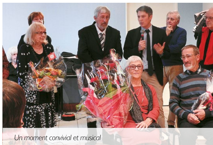
Un moment convivial et musical