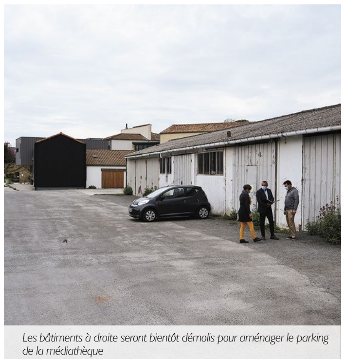
Les bâtiments à droite seront bientôt démolis pour aménager le parking de la médiathèque