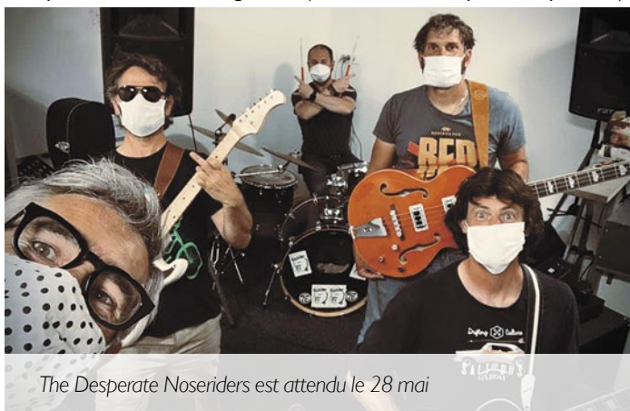
The Desperate Noseriders est attendu le 28 mai

Tout public, entrée libre et gratuite (dans la limite des places disponibles).