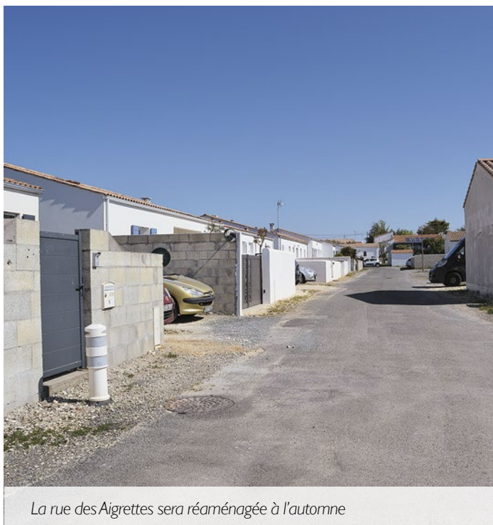
La rue des Aigrettes sera réaménagée à l'automne

* Pour combler le déficit d'investissement de 275 000 €, pour financer les opérations nouvelles de 1 210 000 € et reporter les 1 225 000 € à la section de fonctionnement.