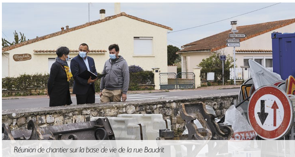
Réunion de chantier sur la base de vie de la rue Baudrit

Pour tous signalements ou questions : secretariat.dst@marenes.fr