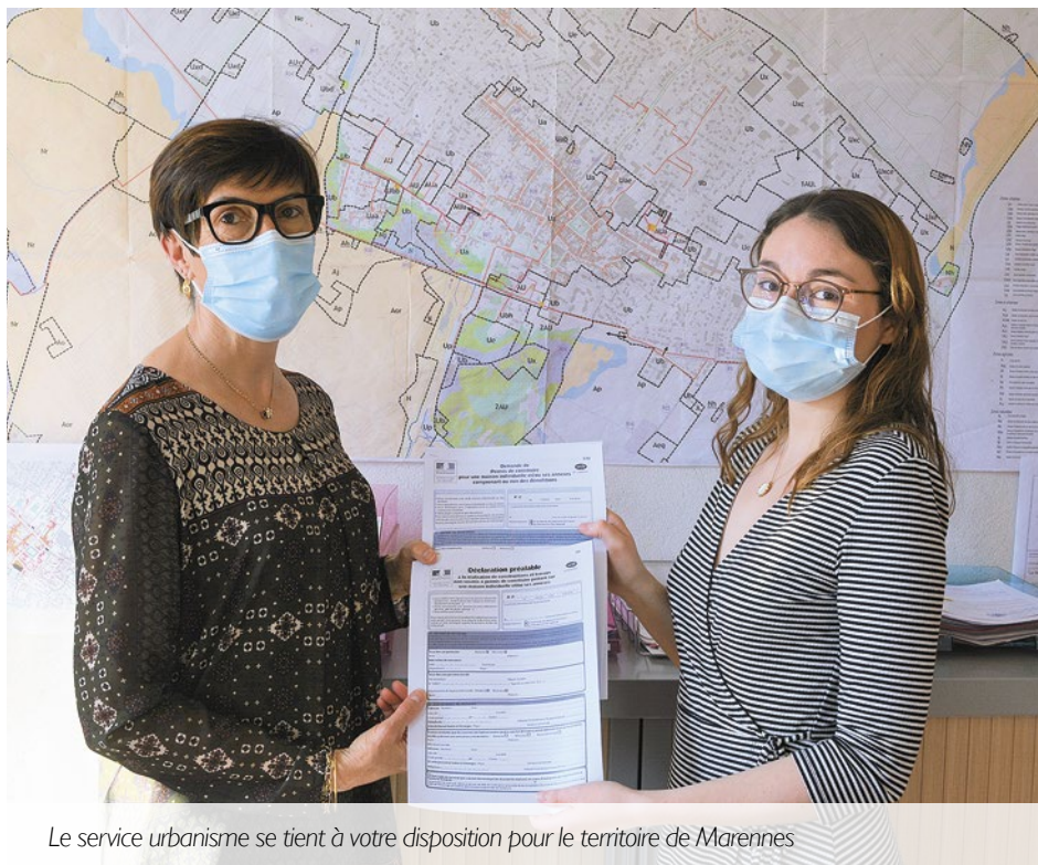
Le service urbanisme se tient à votre disposition pour le territoire de Marennes