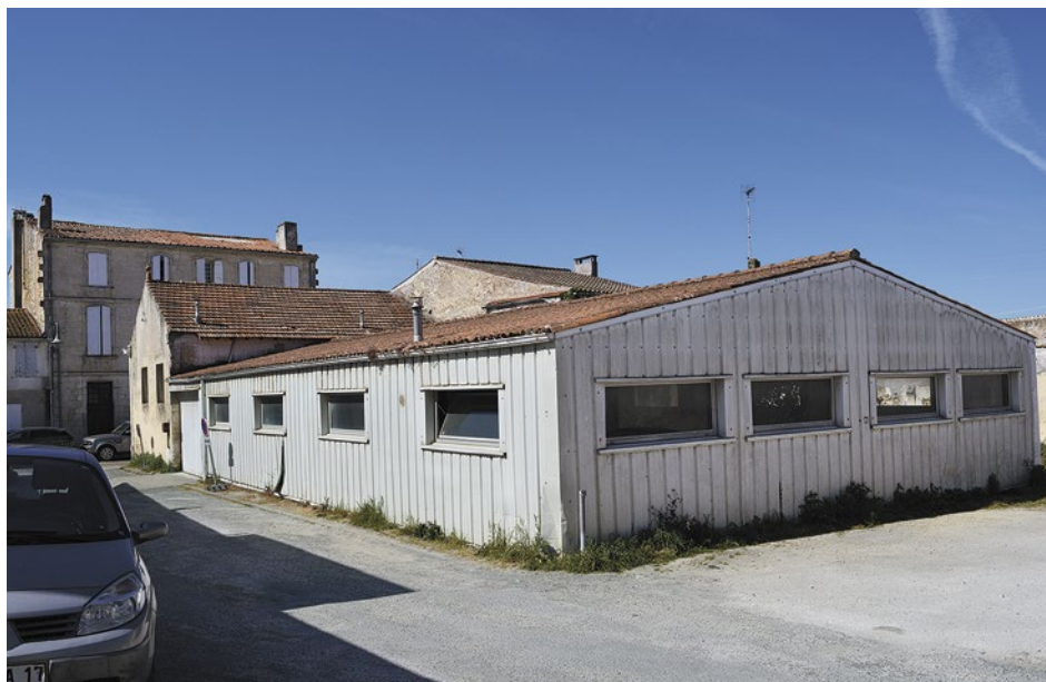
Le bâtiment de l'ancienne imprimerie sera démolit pour l'aménagement de places de stationnement

des foyers, pour lesquels la situation est déjà bien fragile. Par ailleurs, ce budget 2021 est un budget de transition : l'équipe municipale travaille à la détermination des projets structurants à l'échelle du mandat. Pour le moment, nous identifions les besoins et les priorités. Après, ce sera le moment de faire un plan pluriannuel d'investissements, de demander les subventions, de passer les marchés publics et de concrétiser les projets. Nous sommes donc au travail chaque jour, entourés des techniciens, des partenaires institutionnels pour préparer les projets qui répondront aux besoins des habitants en termes de santé, d'habitat, d'enfance et de jeunesse, d'urbanisme. »