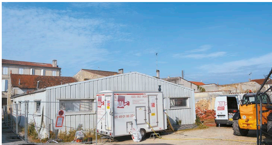
Les travaux de désamiantage ont débuté le 15 juin

sera aménagé avec soin et peut-être réglementé pour que la zone bleue soit étendue dans le but d'éviter les voitures ventouses. Une réflexion est en cours.