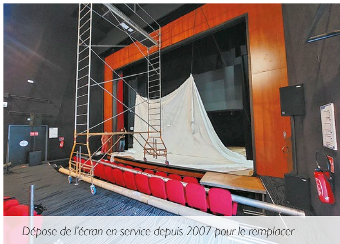
Dépose de l'écran en service depuis 2007 pour le remplacer

Ces mois de fermeture en raison des mesures gouvernementales liées à la crise sanitaire, auront eu au moins un effet bénéfique, le seul assurément : celui d'exécuter les travaux de rafraîchissement du bâtiment. « Nous avons profité de l'interruption d'activité malheureuse de l'Estran pour effectuer quelques travaux nécessaires », indique Claude Balloteau, maire. « Il faut rappeler que la salle est ouverte depuis décembre 2007. Après 14 années d'utilisation et de fonctionnement, il est normal de constater quelques dysfonctionnements. Nous avons donc procédé au changement de l'écran qui avait déjà posé des problèmes de moteurs et de câbles dernièrement. Les films seront maintenant projetés sur un écran lumineux avec une meilleure réflexion ». Cette mission a été confiée à l'entreprise Leblanc Scénique de la Meuse qui a installé le nouveau modèle en une journée. L'ancien écran sera en partie recyclé au centre d'animation et de loisirs. Des interventions ont aussi été menées sur la toiture pour remédier aux fuites d'eau, sur l'éclairage avec la pose de leds qui permettent une économie d'énergie de 4000 kwatt par an et sur l'installation des radiateurs à inertie fluide qui offrent une température constante dans tout le bâtiment. Dès