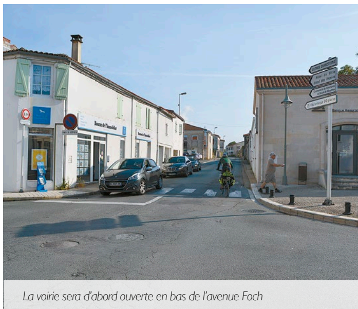
La voirie sera d'abord ouverte en bas de l'avenue Foch

Déviations véhicules légers : pendant la phase de travaux comprise entre la rue de la République et la rue Robert Etchebarne, mise en place de la déviation par la rue Robert Etchebarne, la rue Odile Beillard, la rue du Docteur Roux et la rue de la République. La déviation évoluera quand les travaux auront lieu au carrefour de la rue Etchebarne.