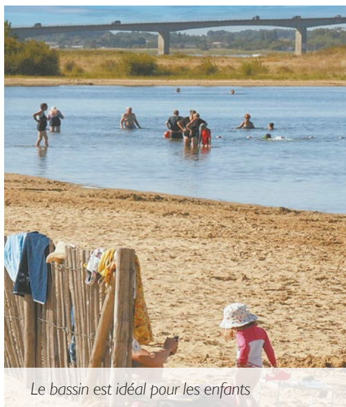
Le bassin est idéal pour les enfants

Depuis les dernières grandes marées fin mai, le bassin de Marennes a retrouvé son niveau d'eau habituel. La plage de sable fin est à nouveau prête pour accueillir petits et grands.