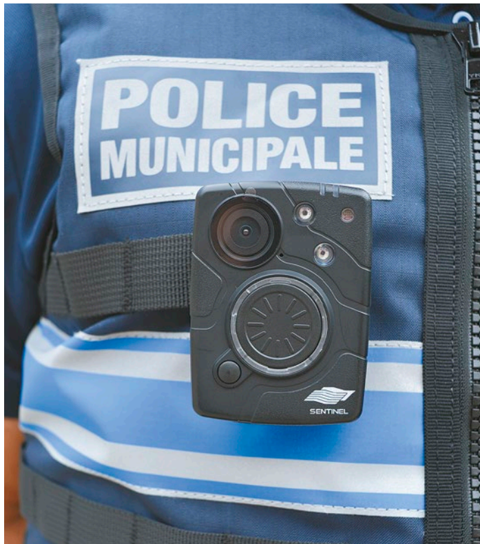
La caméra est placée sur l'uniforme de l'agent

par exemple, le policier municipal prévient qu'il va allumer la caméra », explique Philippe Moinet, premier adjoint en charge de la sécurité.