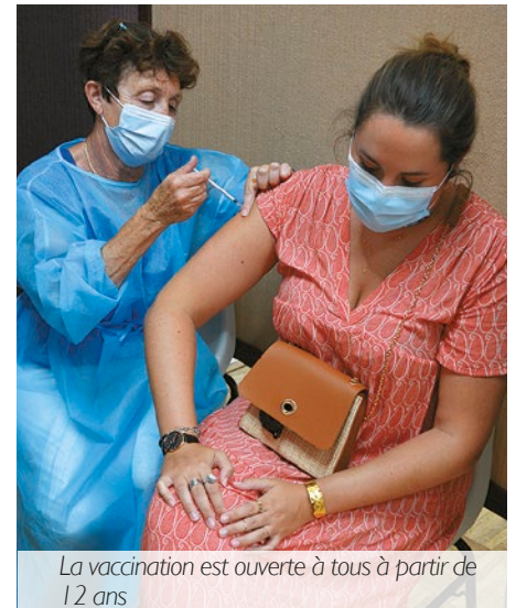
La vaccination est ouverte à tous à partir de 12 ans

Pour prendre rendez-vous au centre de vaccination de Marennes : doctolib.fr et 05 86 57 00 29 (du lundi au vendredi de 9h00 à 12h00 et de 13h30 à 16h00). La vaccination est ouverte sans rendez-vous du lundi au vendredi de 16h00 à 17h00