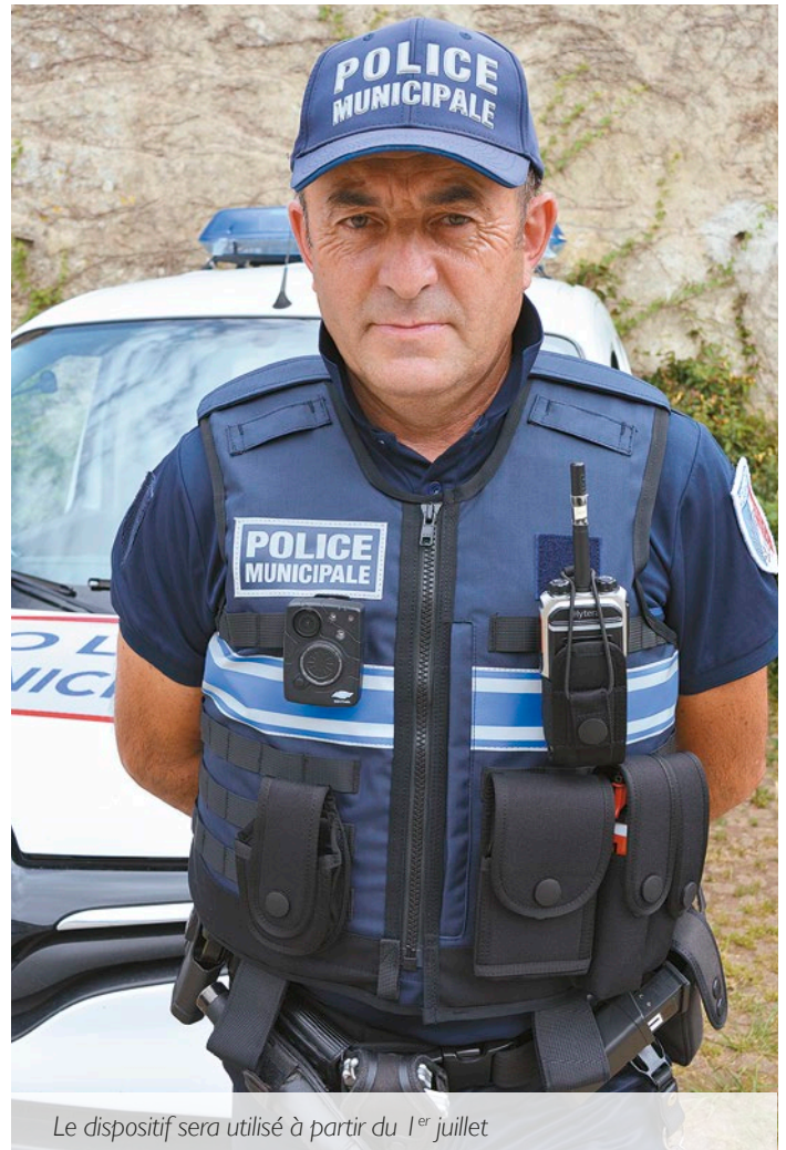
Le dispositif sera utilisé à partir du 1 er juillet

Tout d'abord, les caméras ne seront pas systématiquement enclenchées dès que l'agent part en mission, mais