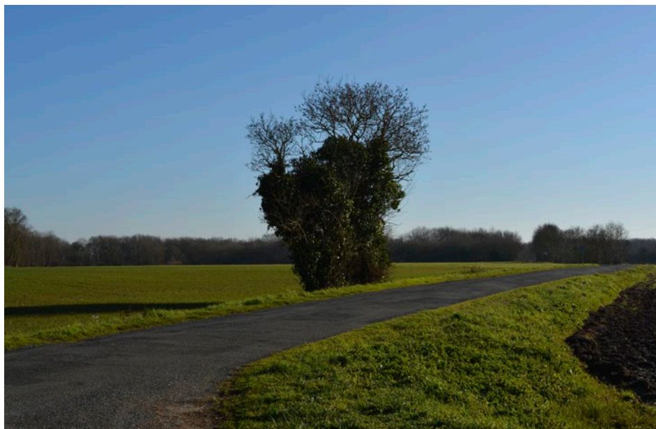
Route de Nodes, trous et bosses seront supprimés

Dans le cadre de l'amélioration des routes, des travaux de voirie auront lieu en mars.