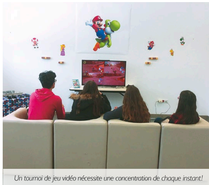
Un tournoi de jeu vidéo nécessite une concentration de chaque instant!

Ouvert à tous, à partir de 15 ans, sur inscription