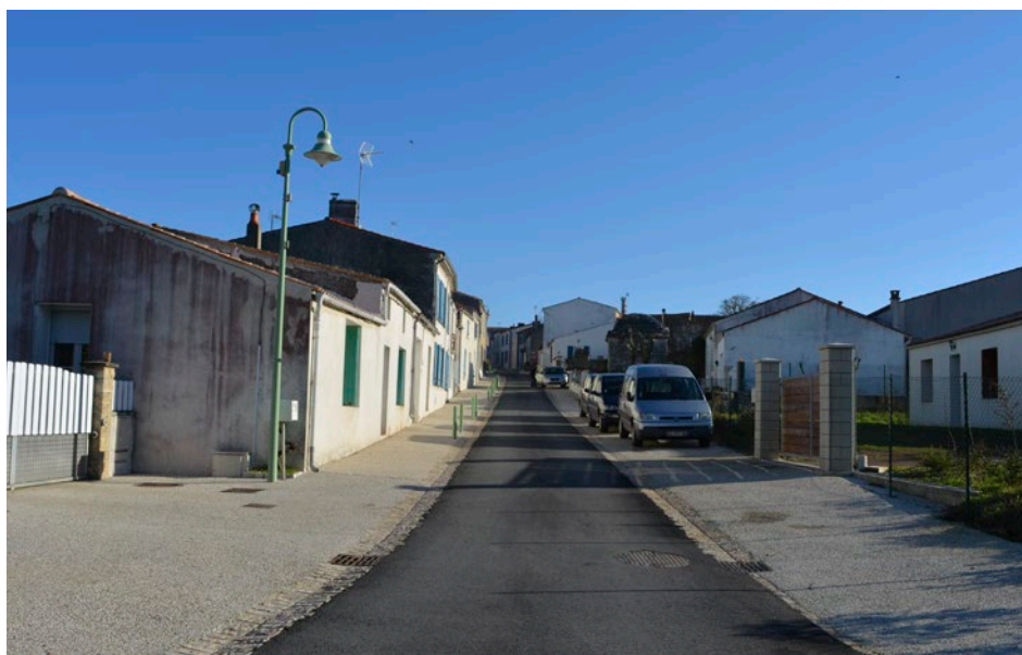
La rue du Duc Élie est terminée depuis plusieurs mois

Après la pose de potelets, des bacs seront bientôt installés pour végétaliser la rue. C'est maintenant au tour de la rue Monboileau de faire l'objet de travaux de mise en place du réseau pluvial et de reprise de la voirie.