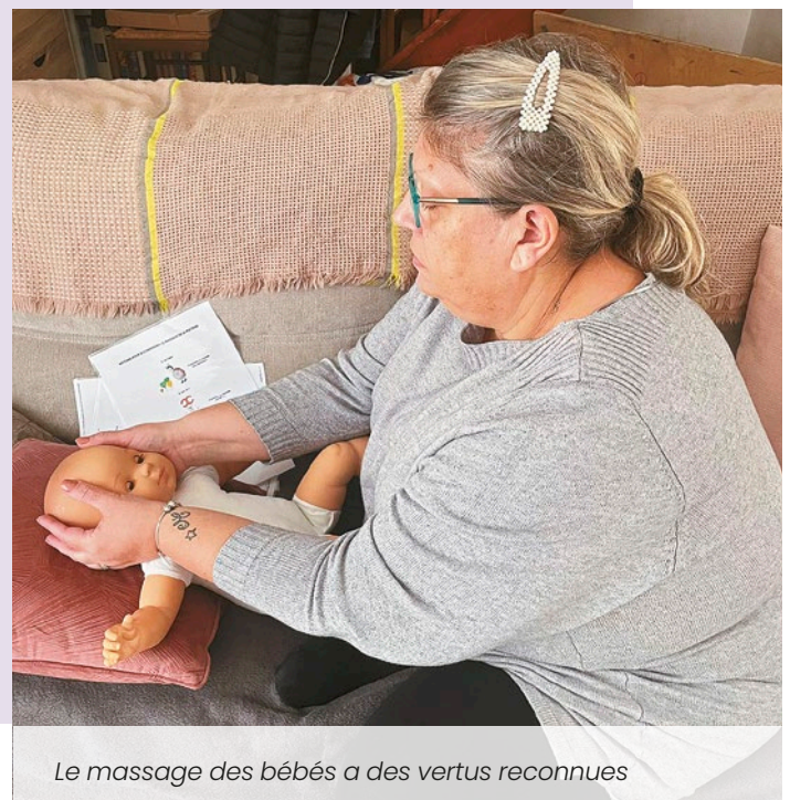
Le massage des bébés a des vertus reconnues

Contact: 06 30 35 81 77 / Premier rendez-vous d'évaluation de 45 minutes gratuit / Formation de consultante en sommeil du bébé et de l'enfant en cours