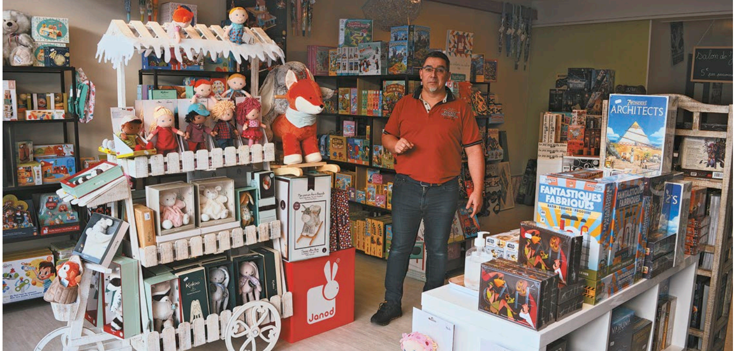
La boutique a été inaugurée le 27 novembre

Nouveau magasin en centre-ville! Les pions dans le sable a investi la rue Dubois Meynardie et propose jouets et jeux de société. Une installation qui conforte la ville dans sa politique incitative de pratique des loyers modérés, grâce à la sous-location.