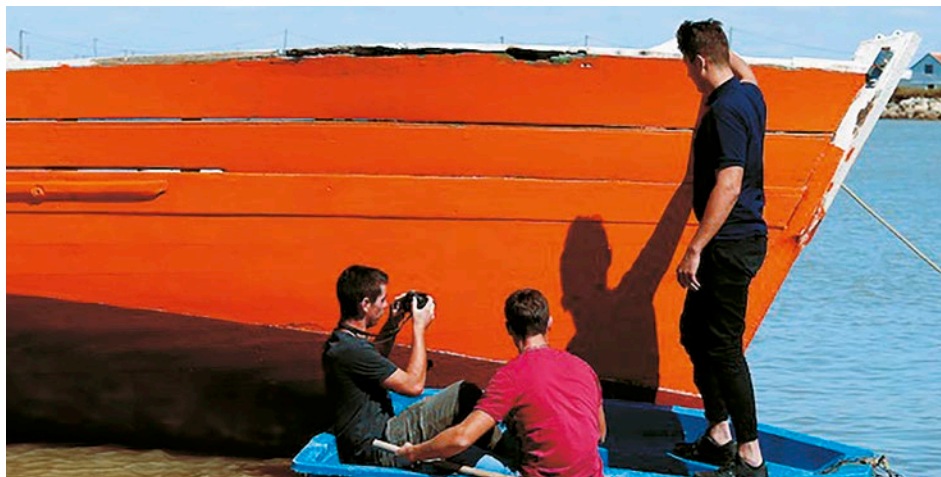
Les bateaux traditionnels ont inspiré les lycéens

Cette exposition de photographies est aussi un beau prétexte pour jouer avec les mots. Sous la guidance de Véronique Amans, venez nombreux participer à l'atelier d'écriture pour coucher librement vos sentiments et laisser libre cours à votre imagination.