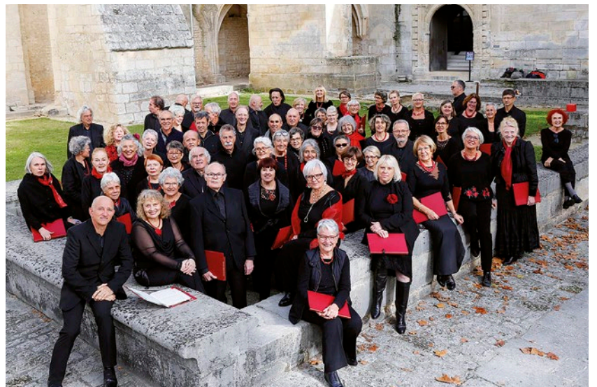
Le chœur de femmes de l'Abbaye aux Dames clôture le festival à Marennes

Samedi 1 er juin 2019 à 20h30 à l'église Saint-Pierre de Sales / Réservation auprès des offices de tourisme du Bassin de Marennes et d'Oléron / Programme complet du festival sur festival-mjpl.com