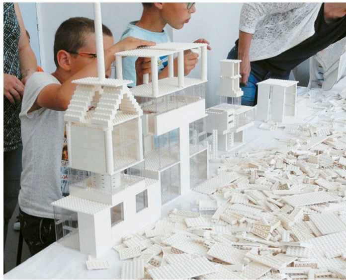
Les Legos, un incontournable depuis des générations