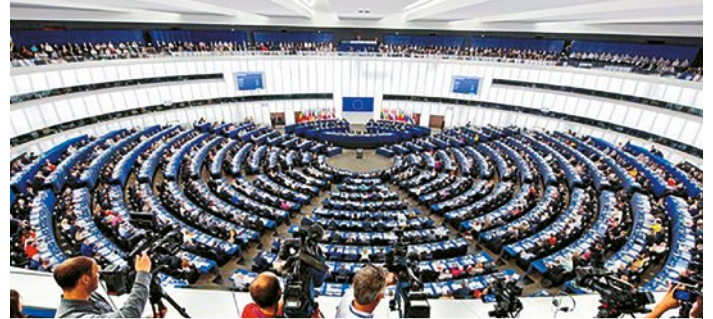
Le 26 mai, le Parlement européen sera renouvelé

Le Parlement européen est la seule assemblée européenne à être directement élue par les citoyens. Il est l'institution qui représente les peuples des États membres de l'UE. Il participe à l'adoption des actes juridiques aux côtés du Conseil des ministres. Il établit, avec le Conseil, le budget annuel de l'Union et dispose de moyens de contrôle de l'exécutif de l'Union Européenne.