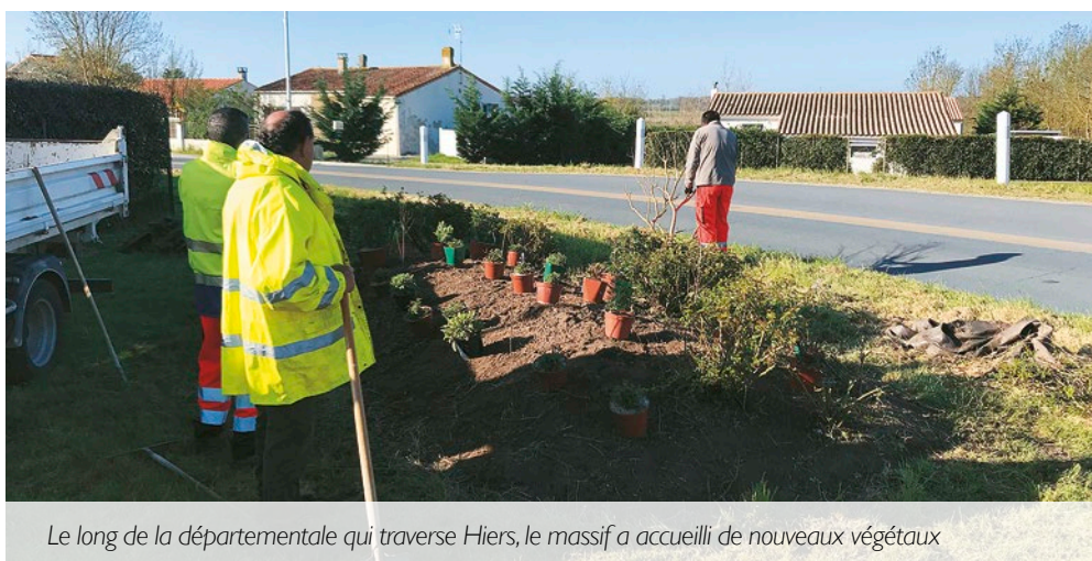
Le long de la départementale qui traverse Hiers, le massif a accueilli de nouveaux végétaux

Pour raviver et agrémenter les massifs situés le long de la départementale et près du petit bateau à Hiers, les agents des services techniques ont procédé à diverses plantations fin mars. Ils ont d'abord créé un nouvel aménagement en retirant les anciens végétaux qui ont été remplacés entre autres par un lilas des Indes de 2 mètres, à la floraison estivale. Le massif situé près du bateau s'est vu enrichi de nouveaux végétaux, choisis dans l'esprit du marais, avec notamment un grand tamaris du meilleur effet.