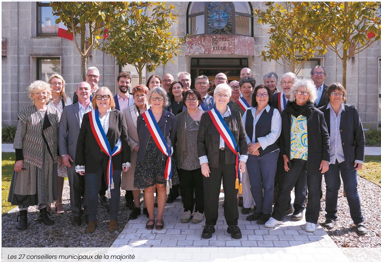
Les 27 conseillers municipaux de la majorité