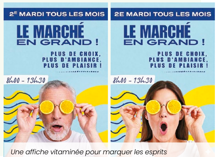
Une affiche vitaminée pour marquer les esprits

Nous vous donnons donc rendez-vous chaque 2 e mardi du mois, de 8h00 à 13h30, pour faire vivre ensemble notre marché en grand