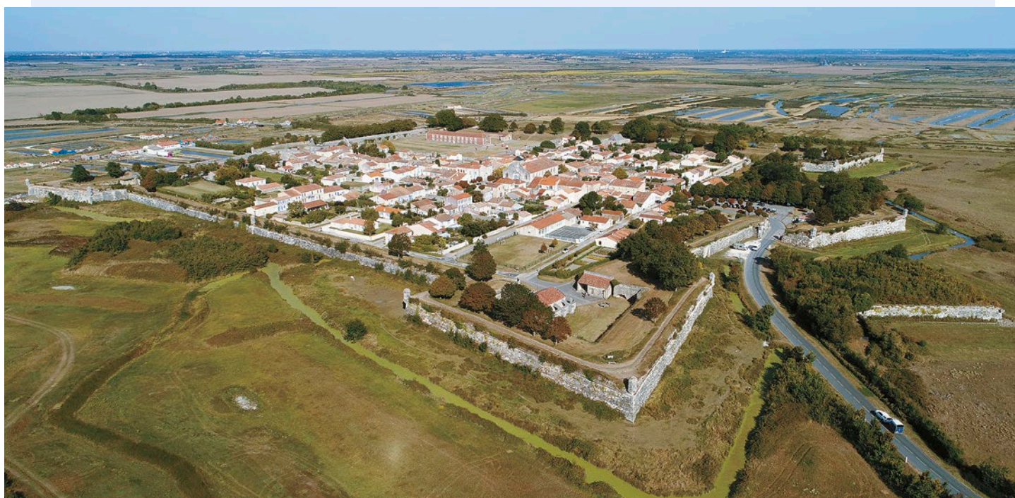
La place forte, site touristique de la commune nouvelle

Le maintien de notre école "Champlain" est au cœur de mes préoccupations ; c'est un engagement que je porterai avec détermination pour garantir l'avenir de nos classes. Parallèlement, l'intégration de Hiers-Brouage au sein de l'opération Grand Site de France et du Parc Naturel Régional est une chance immense. Ces projets nous permettent de protéger notre environnement tout en développant une activité durable qui profitera à tous les habitants.